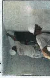
Les ouvriers s'attellent aux finitions.