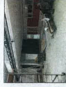
La salle polyvalente peut accueillir 130 personnes assises et se transformer en salle de spectacle.