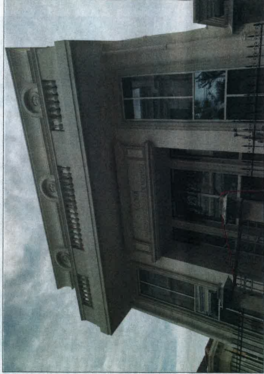
L'entrée principale de la Maison diocésaine de Monaco, rue Bellevue. Mais l'Agora donne également rue Bel Respiro d'où le public peut également accéder.