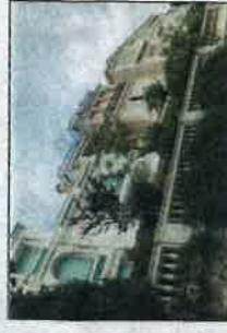
L'entrée principale de l'Agora, rue Bellevue... qui porte bien son nom...