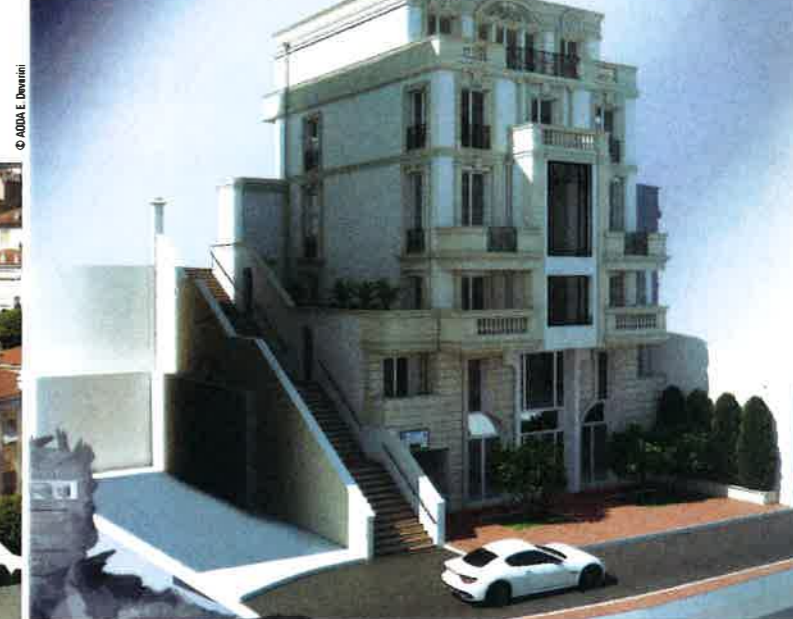
▲ Vue de l'Agora depuis la rue Bel Respiro. VIEW OF L'AGORA FROM THE BEL RESPIRO STREET.